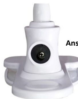
Anschluss für Netzteil