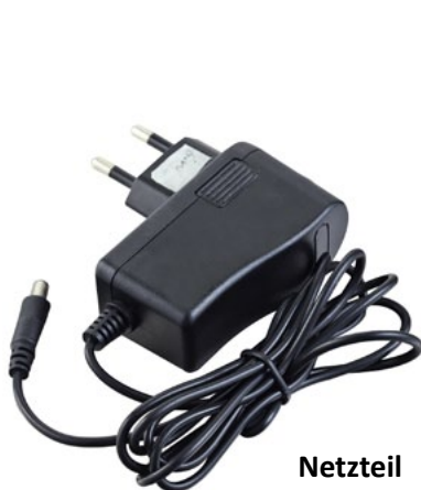
Netzteil (im Lieferumfang enthalten)