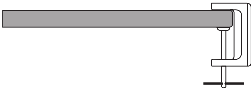
Abbildung 2 Montage der Halterung an der Tisch- bzw. Arbeitsplatte

2. Setzen Sie das untere Metallrohr der LED-Lupenleuchte in die Öffnung der Tischklemme. Die LED-Lupenleuchte muss sich leicht ausrichten lassen, ohne dass sich die Befestigung der Leuchtenhalterung löst. Die Tisch- bzw. Arbeitsplatte darf sich durch eine extreme Positionierung der LED-Lupenleuchte nicht verbiegen.