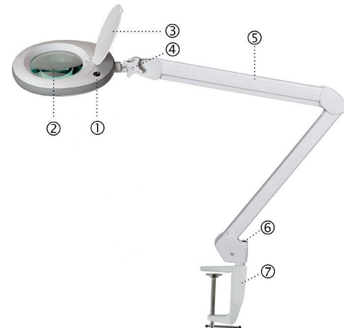
Abbildung 1: Aufbau der LED-Lupenleuchte