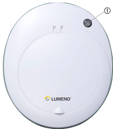
Abbildung 5 Leuchtenkopf der LED-Lupenleuchte

Mit dem Kippschalter (1, Abbildung 5) können Sie Ihre Lupenleuchte auch bei geschlossenem Deckel ein- und ausschalten .