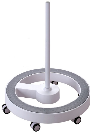
Lumeno Bodenstativ 6159

Weitere Informationen über unser Lupenleuchten - Programm und das passende Zubehör Sie auf unserer Webseite www.lumeno.de